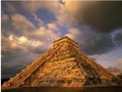
Maya tempel Chichen Itza in Mexico

Waar mensen in de vlakte leefden, bouwen ze een kunstmatige berg, met bovenop de tempel. Daar konden ze dichterbij de godheid dan gewoon in de vlakte.