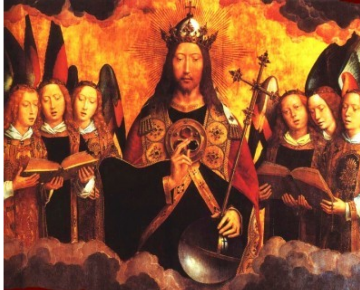
Zegenende Christus met musicerende engelen Hans Memling